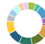
ЄДКІ для здобувачів фахової передвищої освіти зі спеціальності «Медсестринство»

Мета ЄДКІ: оцінити набуття визначених стандартом спеціальних компетентностей здобувачів ступеня фахової передвищої освіти, пов'язаних зі здатністю розв'язувати спеціалізовані задачі та практичні проблеми у сфері медсестринства.