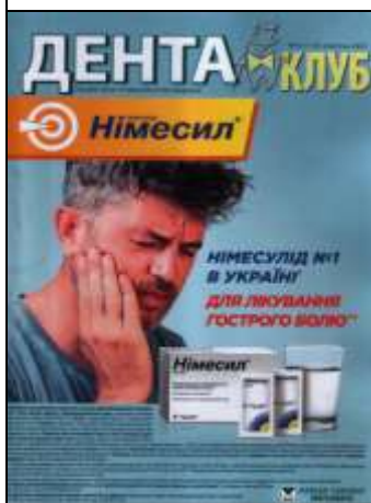
Дента Клуб. – 2021. – №10.