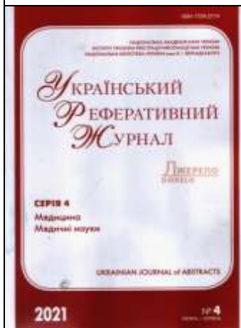
Український реферативний журнал "Джерело". Серія 4. – 2021. – №4.