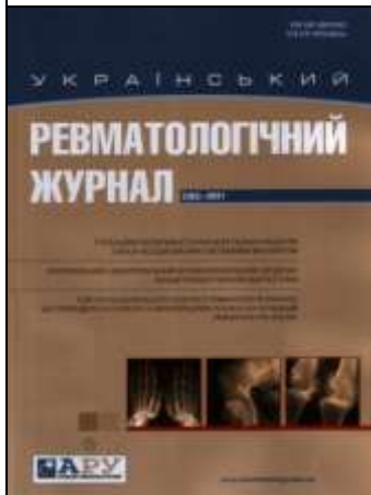
Український ревматологічний журнал. – 2021. – №3.