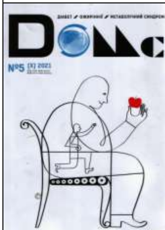
Діабет. Ожиріння. Метаболічний синдром. –2021. – №5.