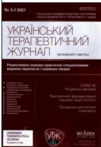
Український терапевтичний журнал. – 2021. – №3.