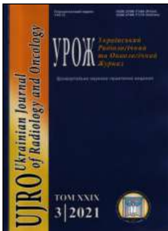
Український радіологічний журнал. – 2021. – №3.