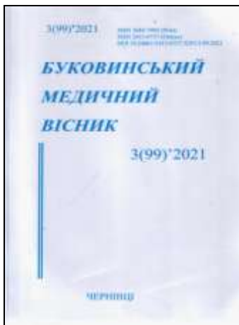
Буковинський медичний вісник. – 2021. – №3.