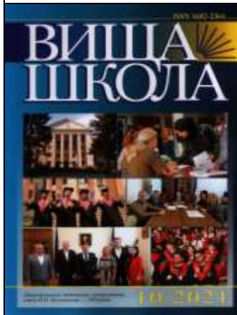
Вища школа. – 2021. – №10.